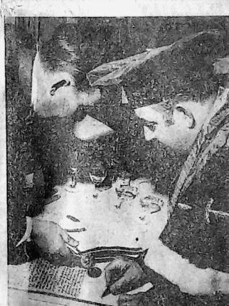
Le Grand Commandeur de la Commanderie des Anquetiers du Roy appose son paraphe sur le document.